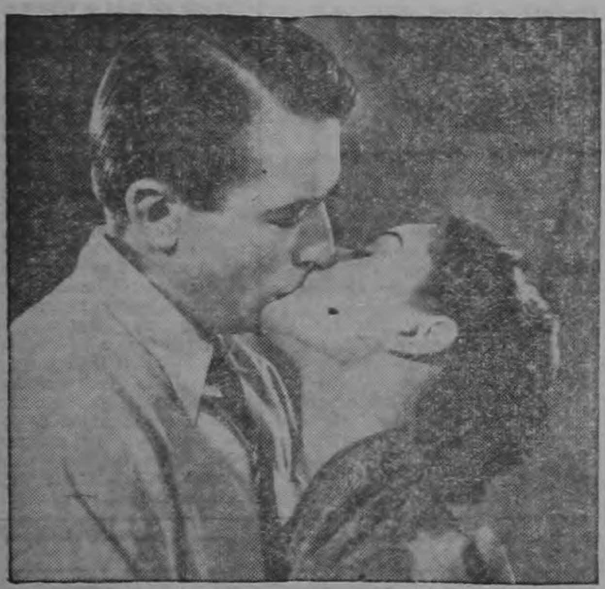
Un espectáculo realmente inolvidable:

Gregory Peck y Audrey Hepburn la revelación de la pantalla, en la fina, delicada y exquisita producción PARAMOUNT filmada totalmente en Roma, y que constituye la película más triunfal del año!!! Un éxito sin precedente de taquilla!!