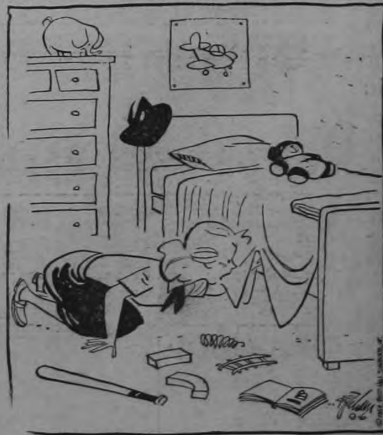
—Daniel, ven acá.. Tu padre bromeaba cuando dijo que te iba a mandar a la escuela de cabeza..