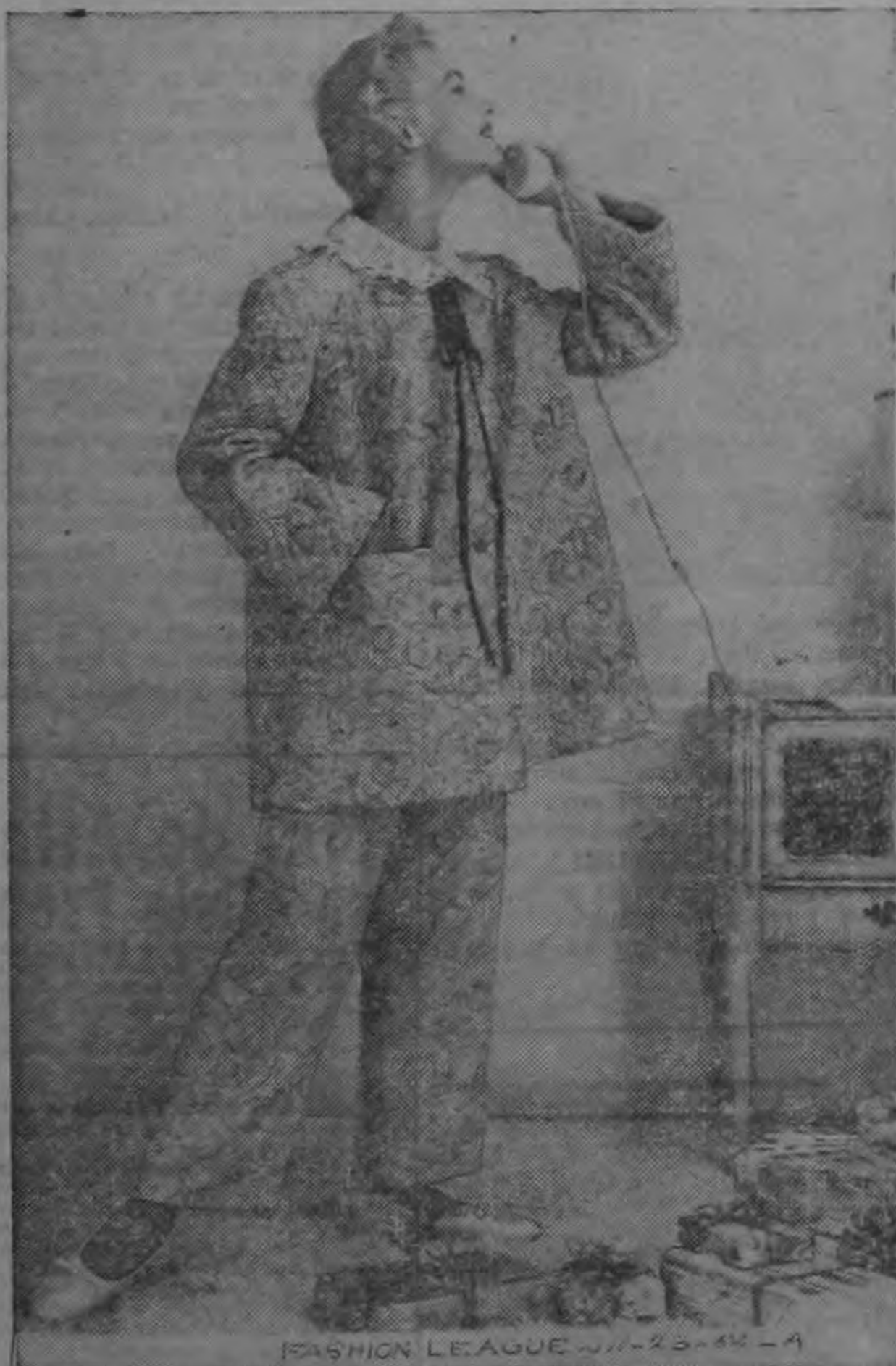
FASHION LEAGUE 2/13/55-4

El viejo favorito, chali, cobra nueva apariencia en este bonito pijama, cuya chaqueta es tan cómoda como elegante, con un corte exquisitamente femenino, realizado por el gracioso cuello y la larga cinta negra que lo cierra.