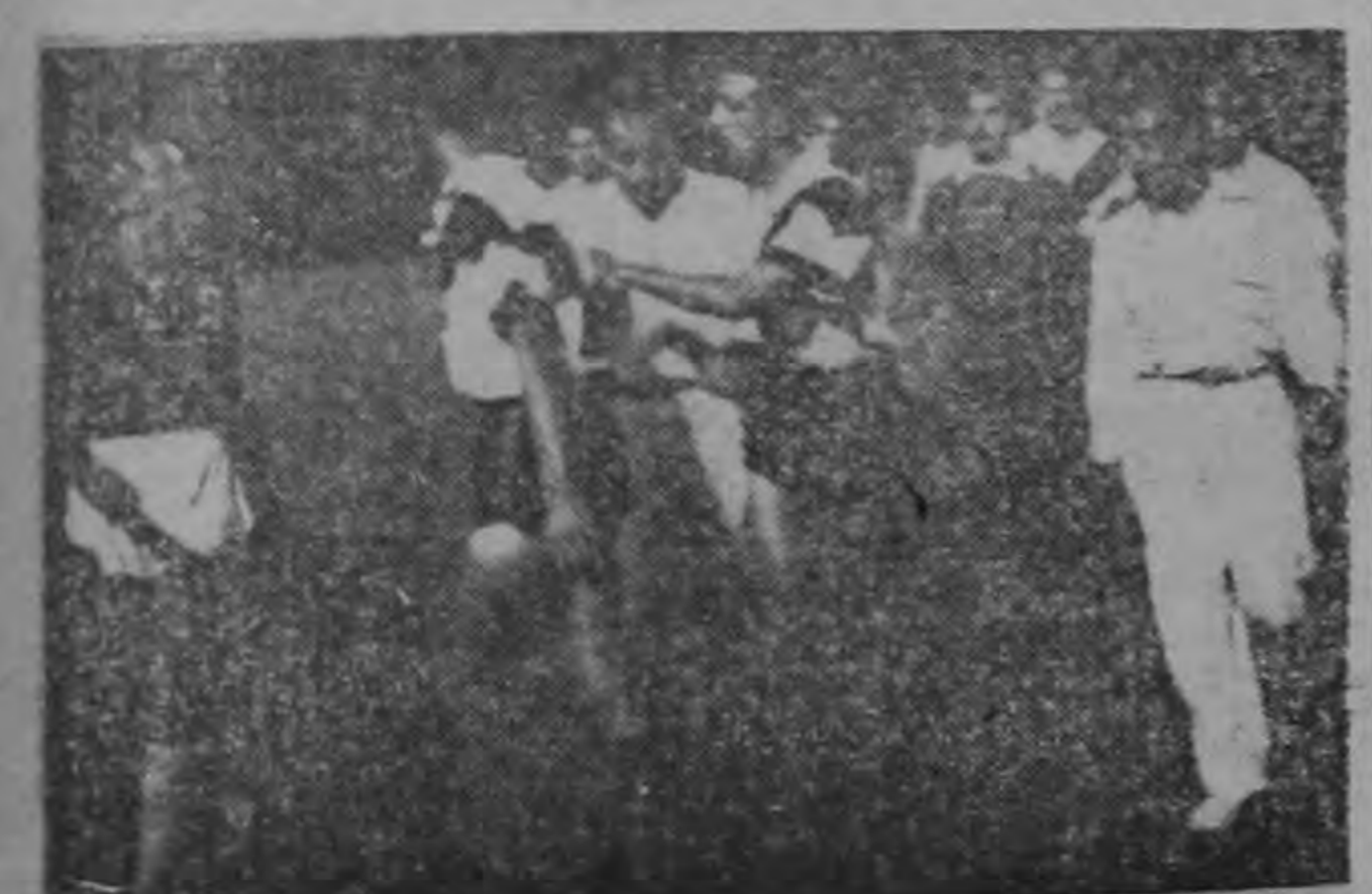
PROTESTANDO.—Así se pasaron el partido los Uruguayos. Cada vez que el Saprissa les dejaba la pelota en los mecates, la emprendían contra el juez y contra los morados.

esfuerzo noble y generoso de este pueblo, guiado por la Junta Progresista del lugar. Esta entidad trató de lograr el terreno y la construcción de la Escuela oficial y ya se han dado los primeros pasos en el proyecto, aunque no se sabe si será construida durante este año o el próximo. Mientras tanto los pandoreños en su rancho no están perdiendo el tiempo.