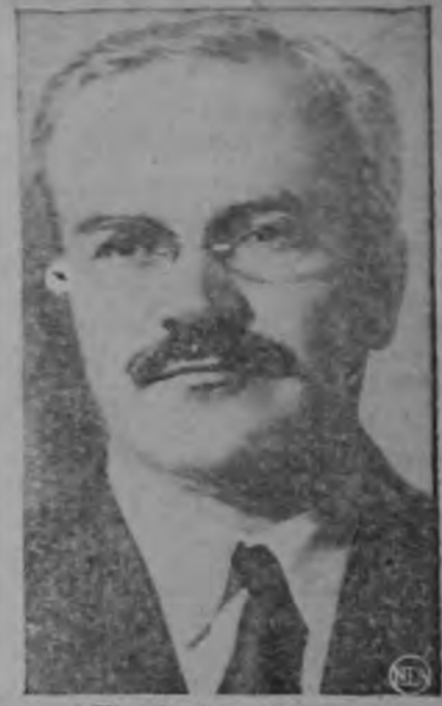
Viascheslav Molotov U. S. S. R.

to de las Naciones Unidas y con Rusia, Inglaterra y la India figurando como potencias coauspiciadoras. En el cónclave intervendrían representantes de Rusia, Gran Bretaña, India, La China comunista, Estados Unidos, Indonesia, Ceilán y otras Naciones asiáticas, pero no así los gobiernos de la China nacionalista, la Corea meridional ni el norte o sur de Vietnam. Los medios diplomáticos de la capital moscovita abrigan serias dudas de que Washington converga en participar en una conferencia que ya se perfila como "caldeada" en la celebrada en Ginebra sobre el problema de la Indochina. No obstante, la nueva iniciativa del Kremlin se interpreta como una maniobra provisional utilizada a producir un período de "enfriamiento" en la caldeada situación formosiana.